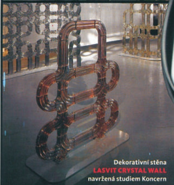
Dekoratívni stěna LASVIT CRYSTAL WALL navržená studiem Koncern

Dámské hodinky PRIM COUPÉR 40 od Lenky Súkupové z luxusní řady Arteu navštívily Londýn a budou i v Superstudiu Designbloku