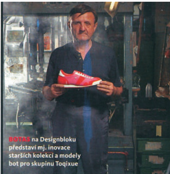
BOTAS na Designbloku představí mj. inovace starších kolekcí a modely bot pro skupinu Toqixue

Galerii snímků z Londýna a Designbloku najdete na reflex.cz/foto