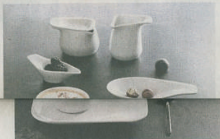
Jako v kavárně Kávový set z kolekce Ellyxyr značky Kahla je inspirován profesionálními stolováním.