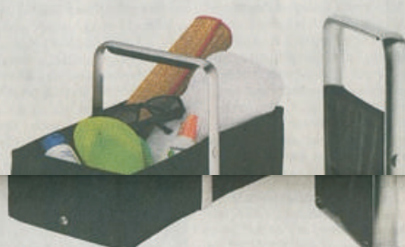
Složená elegancie Na skládací košík Pickup má firma WFM patent, k rozložení vám postačí tři kroky. Podle velikosti má nosnost deset nebo dvacet kilogramů.