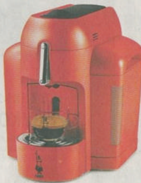
Káva po italsku Espresso od italské firmy Bialetti je určeno i do malého prostoru nebo do malé, tedy single domácnosti.