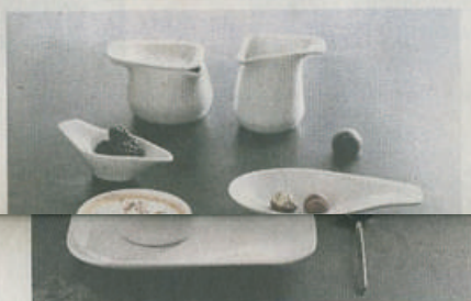
Jako v kavárně Kávový set z kolekce Ellyxyr značky Kahla je inspirován profesionálními stolováním.