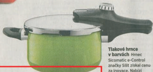
Tlakové hrnce v barvách Hrnce Sicomatic e-Control značky Silit získal cenu za inovace. Nabízí unikátní knoflíky, odnímatelné držadlo a tři úrovně vaření, jež dokážou zachovat vitamíny. Ceny začínají na 5,5 tisíce korun.