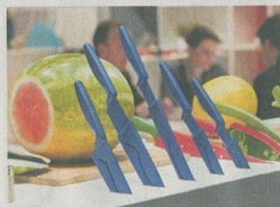
Letos vládnu barvy I nože dostaly letos barevnou podobu. Lze je tak dokonale sladit s dalším vybavením kuchyně.

I talie, kávovary či vafečky mají své veletrhy. Ve světě je nejuznávanější Ambiente, které se konalo v únoru ve Frankfurtu nad Mohanem. Většina výrobců čeká s prezentací novinek na tuto akci. Kdo chce uspět, musí přijít s dobrým nápadem, perfektním zpracováním a zajímavým designem. Cítí se i historie, ale