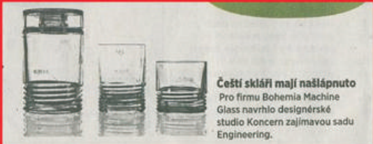
Čeští skláři mají našlápnuto Pro firmu Bohemia Machine Glass navrholo designérské studio Koncern zařadil sadu Engineering.