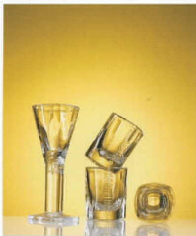
Design shotu a líčkové z lisovaného skla na Becherovku převrací zavedený zvyk dekorovat sklenici zvončím.