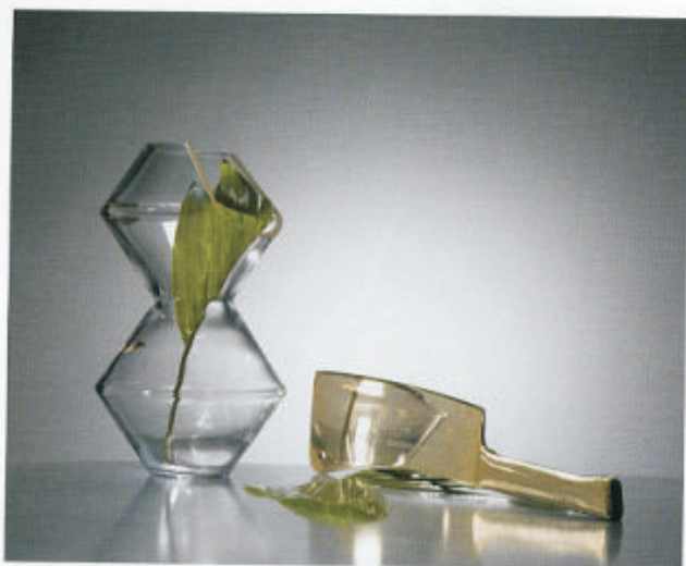
Kolekce skleněných váz a sklenic inspirované domácím násilím nazvaná Domestic Violence – Golden Edition