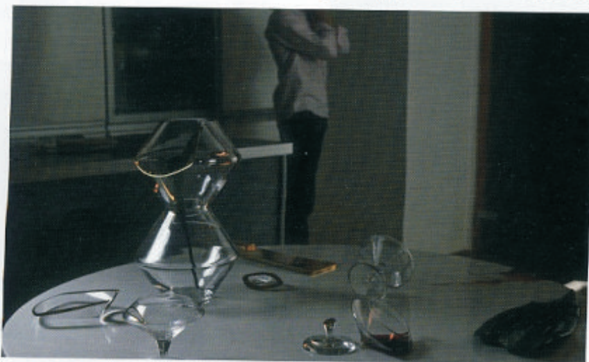
Kontroverzní prezentace konceptuálních projektů

Ano, IKEA kopíruje ve velkém. Její produkty z dálky připomínají tvorbu Jaspera Mor-