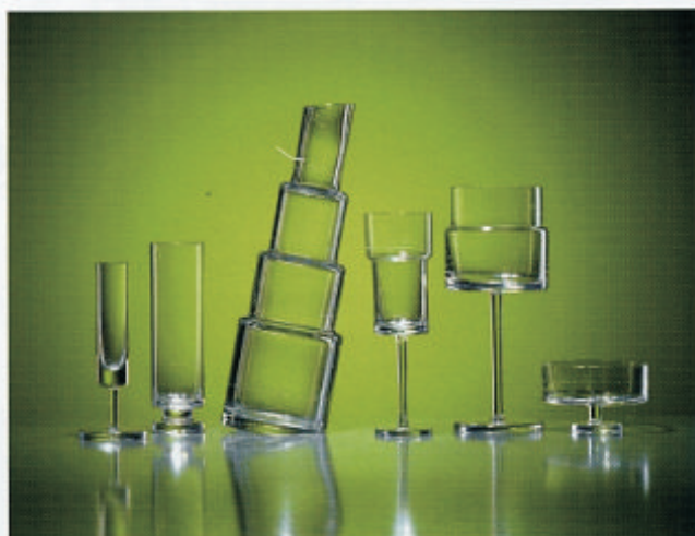
Luxusní ručně vyráběná kolekce skla s rytými technickými údaji Engineering Collection vznikla ve spolupráci se sklárnou Růckl Crystal.