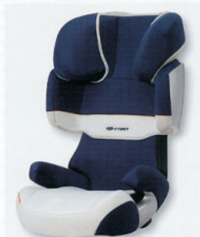
Dětská autosedačka Solution X, vloni oceněná Red Dot Award