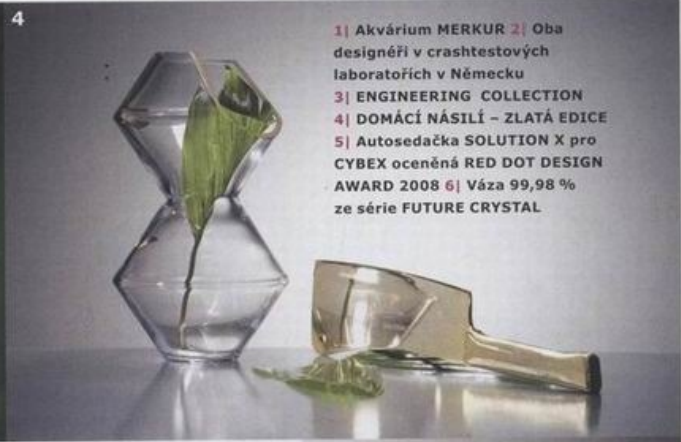
1| Akvárium MERKUR 2| Oba designéři v crashtestových laboratořích v Německu 3| ENGINEERING COLLECTION 4| DOMÁCI NÁSILÍ – ZLATÁ EDICE 5| Autosedačka SOLUTION X pro CYBEX oceněná RED DOT DESIGN AWARD 2008 6| Váza 99,98 % ze série FUTURE CRYSTAL

První produkt ze studia, které vzniklo v roce 2000 zvoláním „Budiž KONCERN!“, naznačil, co se dá od mladých designérů čekat. Jsou to nevšední nápady, pečlivé provedení a slušná dávka recese.