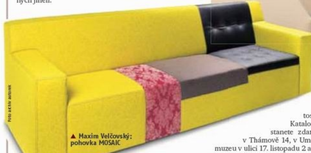
▲ Maxim Velčovský: pohovka MOSAIC