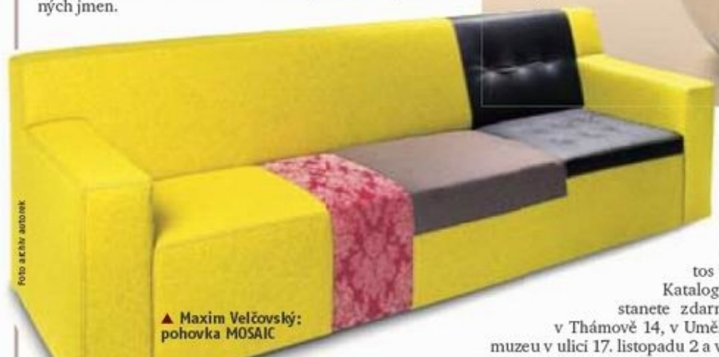
▲ Maxim Velčovský: pohovka MOSAIC